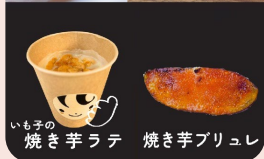
いも子の 焼き芋ラテ 焼き芋ブリュレ